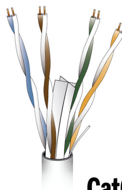
Cat6 CCA Data Cable